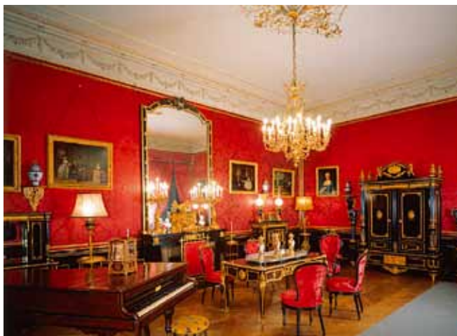
Le Salon rouge