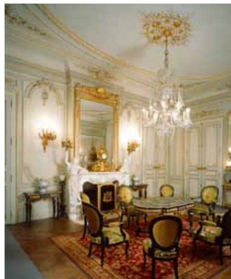
Le Salon vert